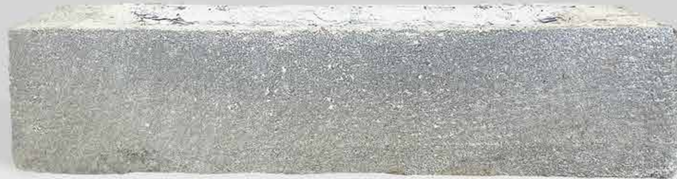
Pisa by Austral Bricks 250 x 55 x 70mm