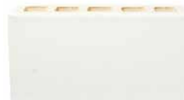
Alicante by Austral, La Paloma range 169147