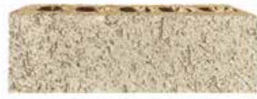
Moondust by Monier, Origin range 481509