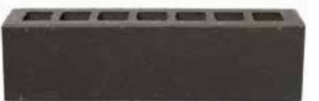
Tenerife by Austral, La Paloma range 166661