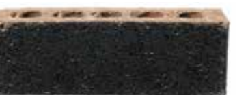
Espresso by Austral, Industry range 169862