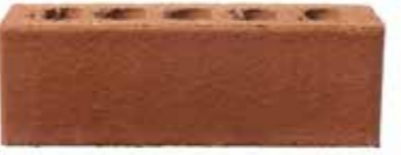
Paprika by Austral, Origin range 467111