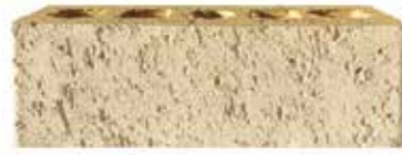
Seed by Austral, Artisan range 483354