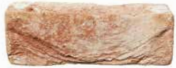
Aged Red by Austral, San Selmo range 450610