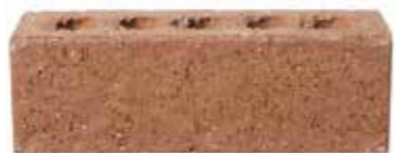
Rust by Austral, Origin range 458675