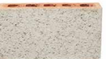
Eros by Austral, Mezzo range 141371