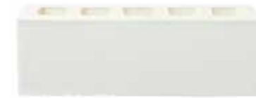
Lorca by Austral, La Paloma range 466035