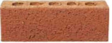
Umber by Austral, Origin range 451590