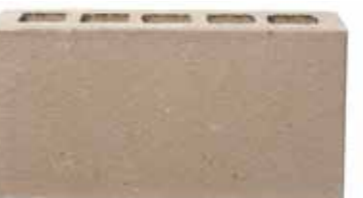
Grenada by Austral, La Paloma range 124833