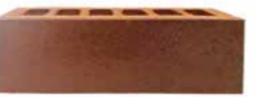
Vigo by Austral, La Paloma range 484900