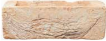
San Selmo Original by Austral, San Selmo range 176461