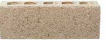
Rockhampton by Monier, Artisan range 194753