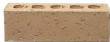
Grange by Austral, Artisan range 120385