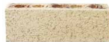
Devon by Monier, Origin range 189374