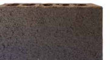
Bronze by Austral, Mezzo range 141283