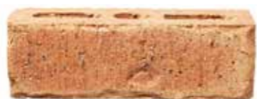
Coach House Cream by Austral, Vintage range 169005