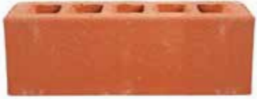
Spanish Red by Austral, Artisan range 472234