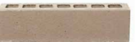
Pamplona by Austral, La Paloma range 166663