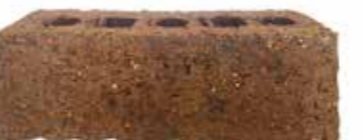
Hartlands by Monier, Artisan range 484901