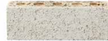
Crevole by Monier, Origin range 169837