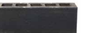
Elda by Austral, La Paloma range 466034