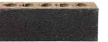
Karekare by Austral, Origin range 458370