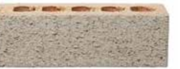
Silver by Austral, Origin range 120300