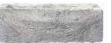
Opaque Slate by Austral, San Selmo range 167250