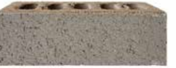
Silver Birch by Austral, Origin range 482975