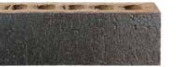
Lithium by Austral, Industry range 475285