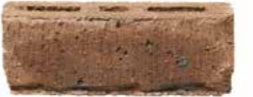
Coach House Grey by Austral, Vintage range 120438