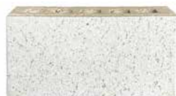
Cloud by Austral, Mezzo range 450611