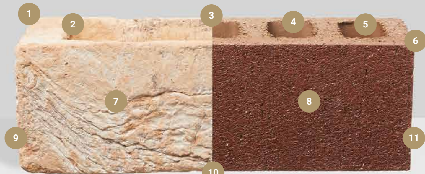
Original by Austral Bricks 230 x 76 x70mm

粘土砖如人；没有两块砖是相同的，没有什么比看到实物样品更好的了，事实上我们坚持要求您这样做。这是关于如何制作砖块的快速指南。