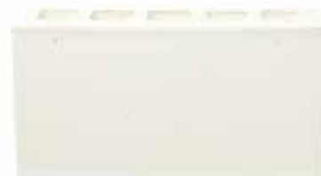
Terrassa by Austral, La Paloma range 124831