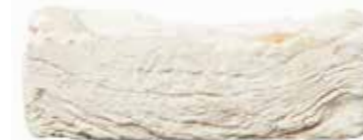
Limewash by Austral, San Selmo range 194797