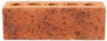
Gypsy Rose by Monier, Artisan range 140623