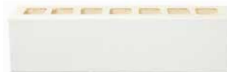
Madrid by Austral, La Paloma range 169148