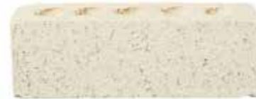
Whitehaven by Austral, Industry range 197197