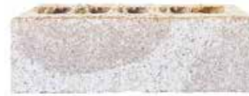
Alpine by Monier, Origin range 140618