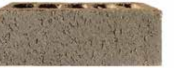
Grey Gum by Austral, Origin range 482974