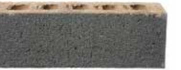
Chiffon by Austral, Origin range 169838