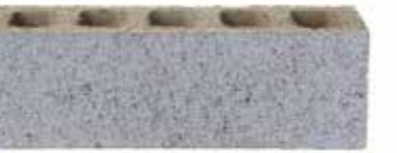
Platinum by Austral, Industry range 182647