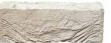
Grey Cashmere by Austral, San Selmo range 167271