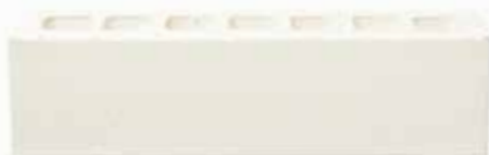
Seville by Austral, La Paloma range 124836