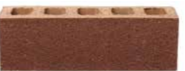
Cuprum by Austral, Industry range 193068