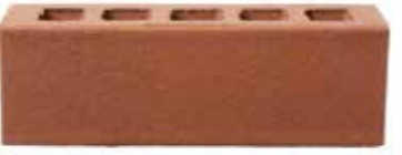
Russo by Austral, Artisan range 467814