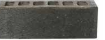
Azul by Austral, La Paloma range 197051