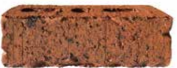
Coach House Red by Austral, Vintage range 120437