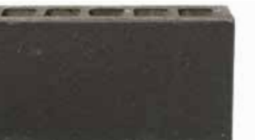
Lanzarote by Austral, La Paloma range 166662