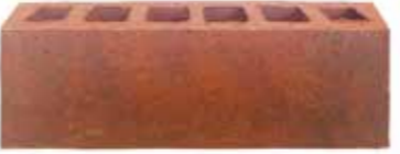
Zamora by Austral, Artisan range 485113